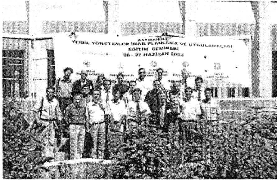
Batman Yerel Yönelimler İmar Planlama ve Uygulama Eğitim Semineri

TMMOB Genel Merkezinde ihale bulunmayan ve ilk olarak TMMOB Diyarbakır İKK birimleri bünyesinde kurulan Kadın Komisyonu ve İKK toplantılarına aktif katılım sağlanmıştır.