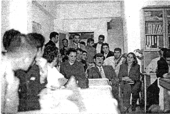
Van II Temsilciliği üye toplantısı

Şubemize bağ Van II FAALİYETLERİ Temsilciliğimizin yeni dönem il temsilciliği yürütme kurulunun belirlenmesi amacıyla 9 Haziran tarihinde geniş katılımlı bir üye